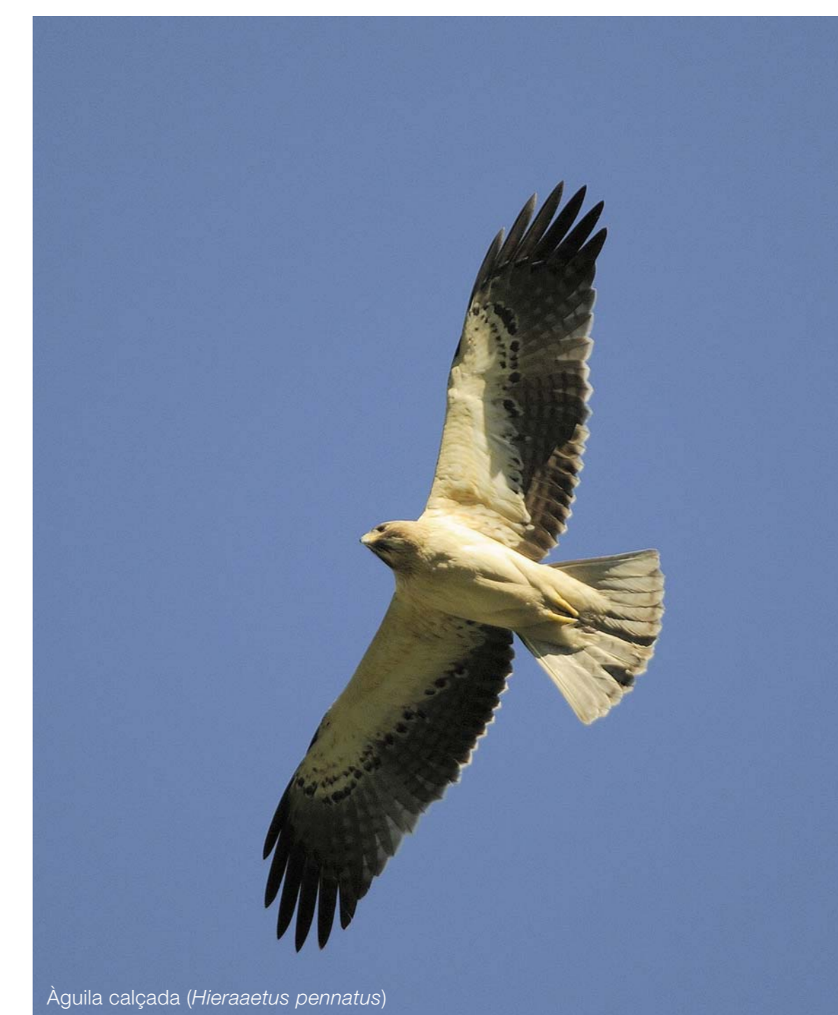
Àguila calçada (Hieraetus pennatus)

El camí vell de Lluc recorre una gran diversitat de comunitats: garriga, camps de conreu, alzinar, torrents, etc., però quan caminem també ens hem de fixar amb la gran quantitat de vegetació ruderal, entre la qual podem destacar la coa de cavall ( Equisetum ramosissimum ) i algunes orquídies del gènere Orchis conegudes popularment com "sabatetes".